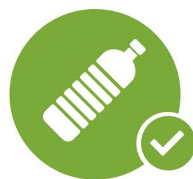
一瓶除去标签的饮用水